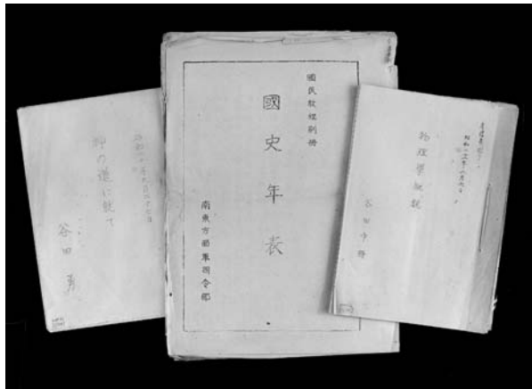
These textbooks on religion, history, and morals were used for educational lectures at Rabaul while Japanese servicemen were awaiting repatriation to Japan.

Education and training programs had commenced, thanks to General Imamura's foresight and initiative, before requests for such programs were made by the servicemen.