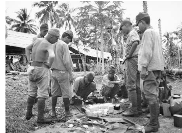
Japanese soldiers prepare a meal in October 1945. The Australians had underestimated Japanese numbers and could only provide supplements to provisions.