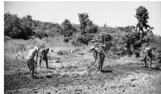
Many lower-ranked Japanese servicemen had a farming background and the gardens they established went a long way to creating a self-sufficient food supply on Rabaul.

1945年9月10日、残留日本兵の数が多いため、スターディー中将は珍しい命令を出した。第1に、日本軍は自分達が入るキャンプを建設すること、そして第2に、日本軍は